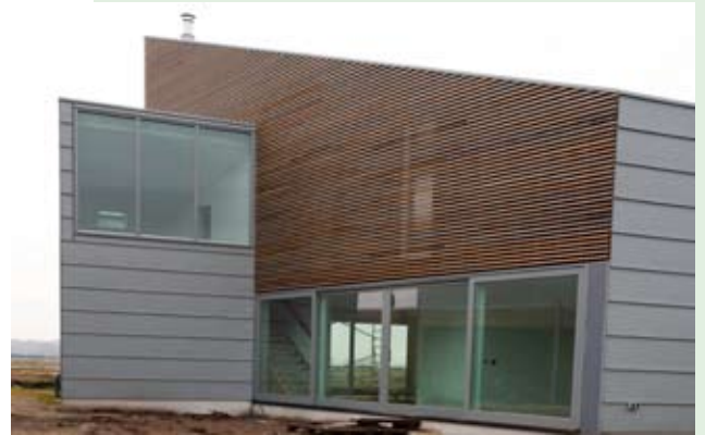
Waterwijk woonhuis, Eelderwolde, BO6 architecten Amsterdam