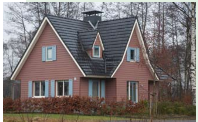
Schelfhorst recreatiewoning, Schelfhorst, Tasta Bouw