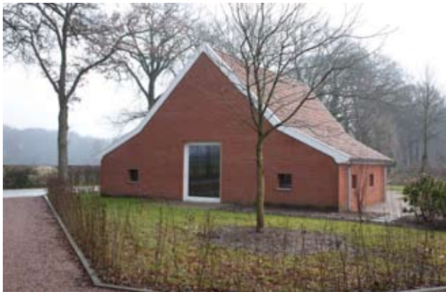
Huisje aan de straat bij project Hooiweg, Paterswolde