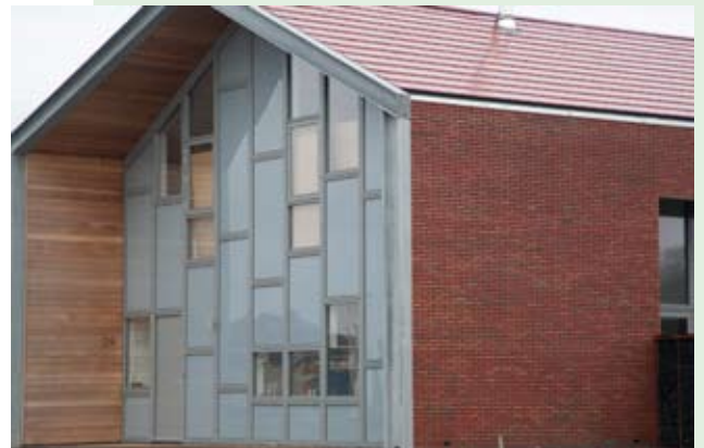
Waterwijk woonhuis, Eelderwolde, Team 4 architecten Groningen