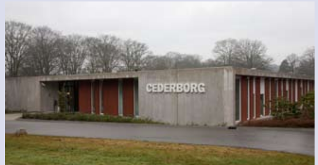
Behandelgebouw op terrein Dennenoord, Zuidlaren Atès architecten