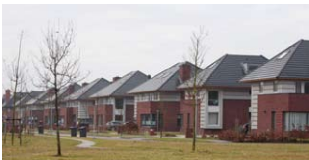
Tuinwijk, Eelderwolde Architectenbureau Noordeloos