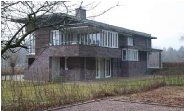
Woonhuis Hooiweg, Paterswolde Architect Cor Kalfsbeek