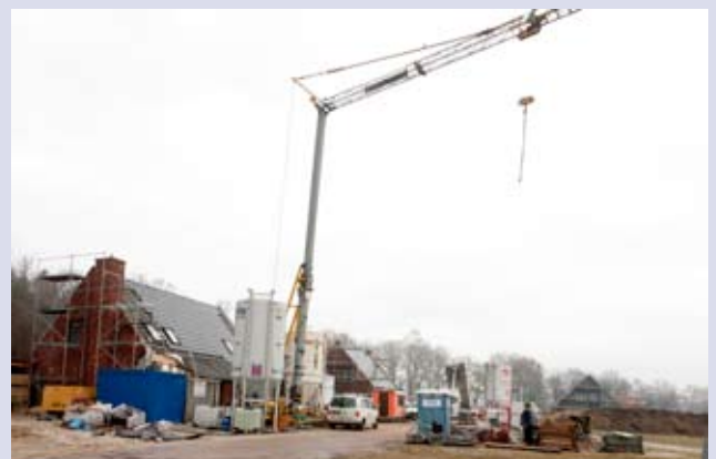
Nieuwe woonwijk Oude Tolweg, Zuidlaren, Architect Jaap Stobbe