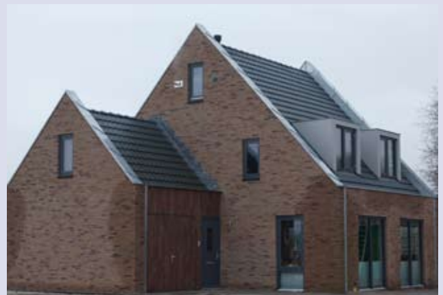
Nieuwe woonwijk Oude Tolweg, Zuidlaren, Groothuis Bouw