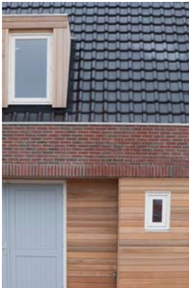
Detail Oude Tolweg, Zuidlaren, Brummelhuis