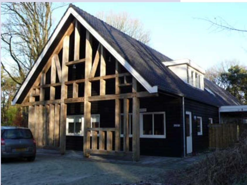
Clubgebouw Toneelvereniging Diever, Hezenes, Diever, ontwerp W. v.d. Salm