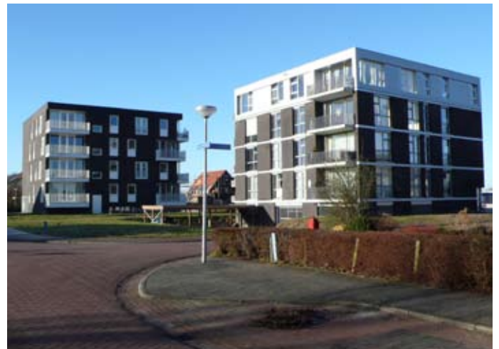
Woningbouw Meerkamp Havelte, ontwerp DAAD Architecten, B+O Architecten, SchuurmanKuipers Architecten.