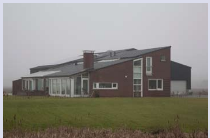
Agrarisch bedrijf, Nieuw Buinen