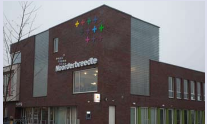
MFA, Nieuw Buinen